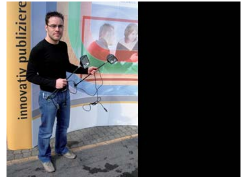
Nehmen Sie die Halogenspot zur Hand.