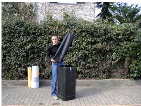
Nehmen Sie zuerst den Print aus dem Koffer. Anschliessend die beiden Säcke.