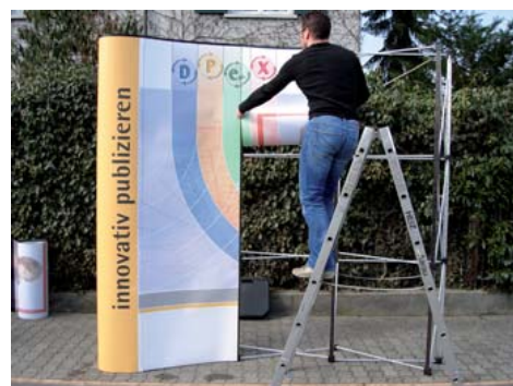
Bahn für Bahn.