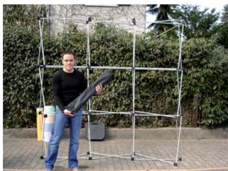
Nehmen Sie den Sack mit den Vertikalstreben zur Hand.