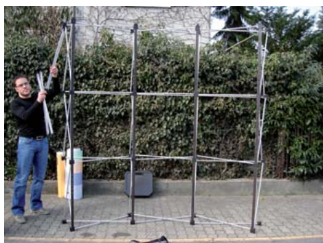
Auch auf der Rückseite die Bahn aussen mit den Horizontalstreben bestücken.