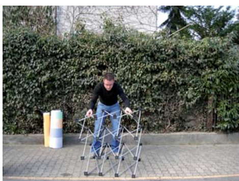
Ziehen Sie das Rahmengestell auf die volle Grösse auf.