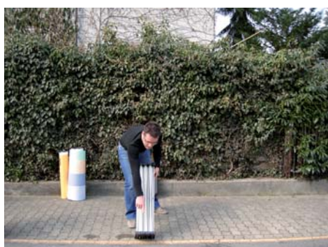
Legen Sie das Rahmengestell auf den Boden, so dass die Pins vorne nach oben zeigen. Die Lampenbefestigung je nach Stellungswunsch, auf den inneren oder äusseren Streben aufschrauben. (Bsp. aussen.)