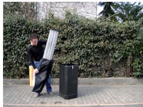
Packen Sie das Rahmengestell aus.