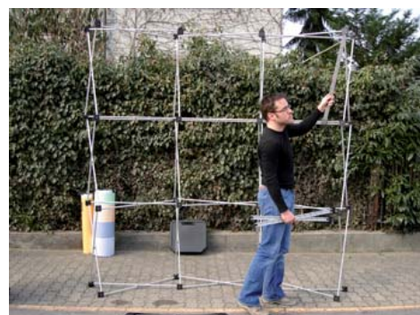
Von oben nach unten einklinken.