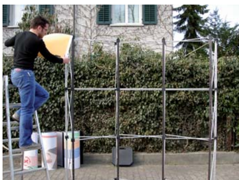
Beginnen Sie mit den Paneelen bestücken. Von oben nach unten.